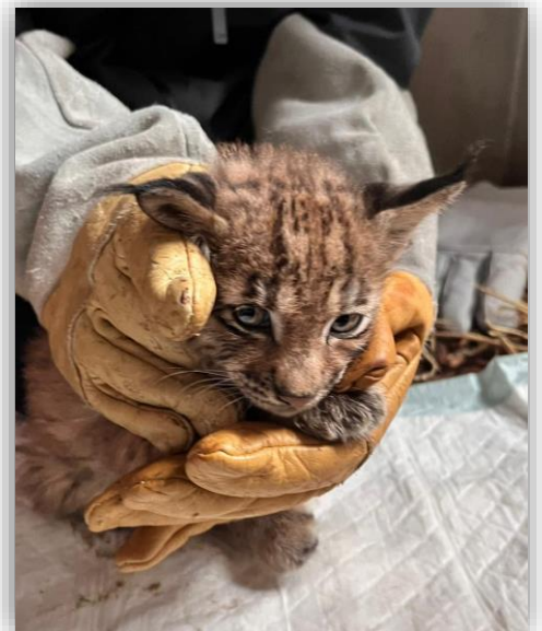
Photographie : S.Farny