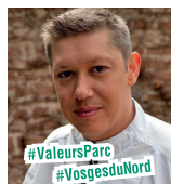
■ ANTHON OBERSTEINBACH J4

Georges FLAIG 40 rue Principale - 67510 info@restaurant-anthon.fr 03 88 09 55 01