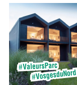
■ LA SOURCE DES SENS SPA MORSBRONN-LES-BAINS L7

63 route d'Ingwiller - 67290 info@la-clairiere.com 03 88 71 75 00