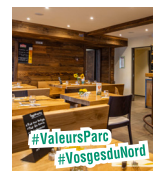
■ KEIMBERG GLEEBOURG N4

Congrégation des Sœurs du Très-Saint-Sauveur 2 rue Principale - 67110 contact@hotellerieducouvent.com 03 88 80 84 50