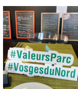
■ BISTROT DU MUSÉE WINGEN-SUR-MODER E7

Guillaume KASSEL 7 rue du vieux moulin - 67320 guillaume.kassel@gmail.com 03 88 70 17 28