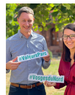
■ HÔTELLERIE DU COUVENT OBERBRONN i6

Groupe LALIQUE 2 rue du Château - 67290 communication@chateauhochberg.com 03 88 00 67 67