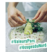
■ LA CLAIRIÈRE BIO SPA LA PETITE PIERRE D9

Esther & Thomas LIMMACHER Uniquement le restaurant 3 rue de Sultz - 67360 baechel-brunn@wanadoo.fr 03 88 80 78 61