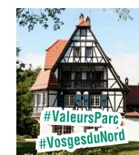
■ VILLA RENÉ LALIQUE WINGEN-SUR-MODER E7

Cynthia & Lutz JANISH 24 rue du colonel Teyssier - 57230 le-strasbourg@wanadoo.fr 03 87 96 00 44