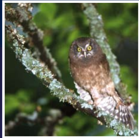
▲ Aegolius funereus