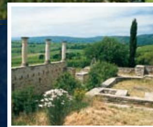
▲ Les ruines d'une villa romaine à Weilberg