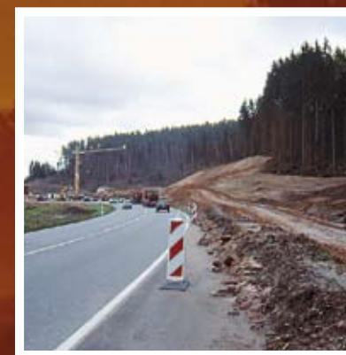
▲ Le développement urbain et routier diminue l'espace naturel

À l'aube de ce siècle, nous sentons bien que de grands défis nous attendent. Pour la première fois, les enjeux, qui touchent notre territoire, ne sont plus d'essence strictement locale ou régionale. Ils sont d'essence planétaire.