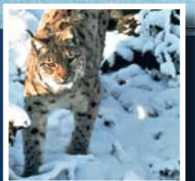
▲ Lynx lynx

Le substrat géologique, le grès vosgien, sur lequel est assise la réserve de biosphère, explique l'importance de son couvert forestier soit 74% de la superficie. Cette forêt est dominée par trois essences : le hêtre, le pin sylvestre et le chêne. De Saverne à Kaiserslautern, on voit des montagnes entaillées de vallées parcourues de ruisseaux sur grès, et ponctuées d'étangs artificiels. Au niveau du patrimoine naturel, la réserve de biosphère abrite de nombreuses espèces