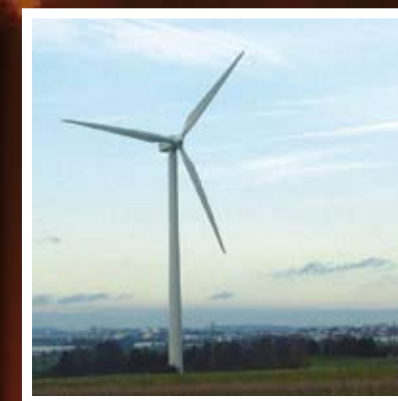
▲ Promouvoir les énergies renouvelables, une nécessité