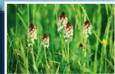
▲ Orchis ustulata