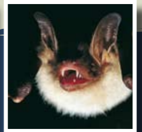
▲ Myotis myotis