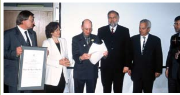
▲ Remise du diplôme de l'UNESCO