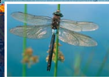
▲ Anax parthenope