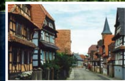
▲ Village du Piémont alsacien