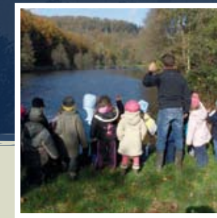
▲ L'éducation à l'environnement