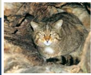
▲ Felis sylvestris