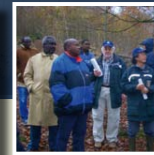
▲ La première rencontre mondiale des réserves de biosphère