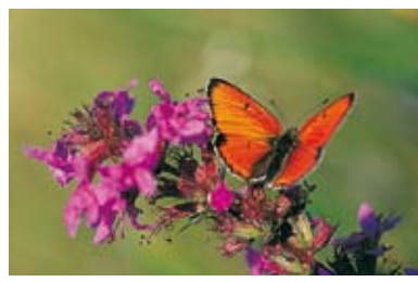
▲ Lycaena dispar