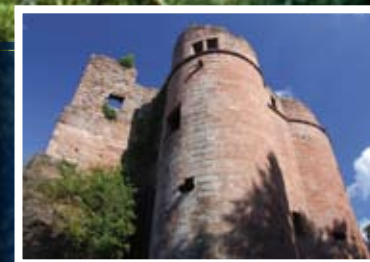
▲ Le château-fort de Neudahn