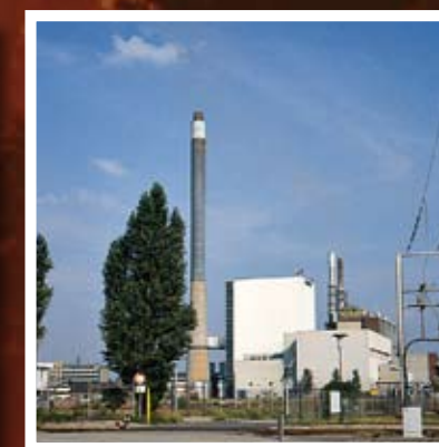
▲ L'impact des zones industrielles sur l'environnement naturel, une question encore peu étudiée