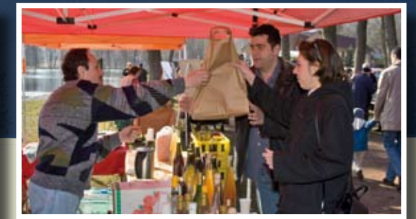
▲ Le marché paysan transfrontalier

Avant la création de la réserve de biosphère "Vosges du Nord-Pfälzerwald", les actions de coopération transfrontalières avaient été mises en œuvre par les deux parcs naturels, porteurs respectifs des réserves de biosphère nationales. Elles portaient principalement sur le développement des infrastructures transfrontalières de randonnée et de découverte, ainsi que sur les échanges scolaires. Dans les années 1990, ces programmes de coopération transfrontalière se sont très fortement intensifiés, sous l'impulsion des programmes européens Life et Interreg :