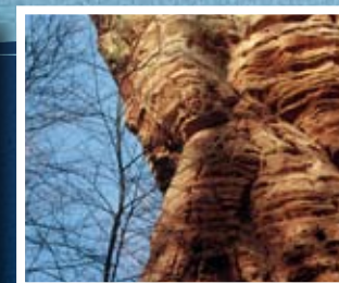
▲ Falaise en grès