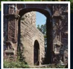
▲ L'entrée du château-fort de la Hohenburg

De nombreux vestiges du passé jalonnent le territoire de la réserve de biosphère. Traces d'occupations néolithiques, vestiges d'oppidums romains, centaine de châteaux ruinés, citadelles et forteresses, monuments de la guerre de 1870, bunkers des lignes Maginot et Siegfried : tout ici renvoie à la mémoire du passé pour mieux aider à préparer l'avenir.