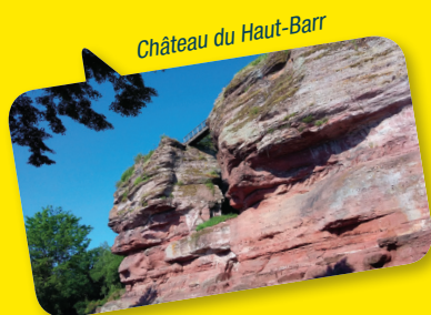
Château du Haut-Barr

Rejoindre le centre-ville en suivant. Au canal, emprunter la piste cyclable vers le centre-ville jusqu'à l'écluse 16 bis.