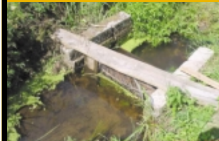
Les seuils, les barrages, ou d'autres ouvrages hydrauliques empêchent la libre circulation du chabot et menacent certaines populations