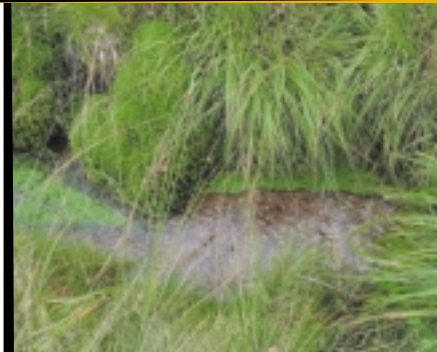
Les cours d'eau bien conservés abritent de très belles populations de chabot