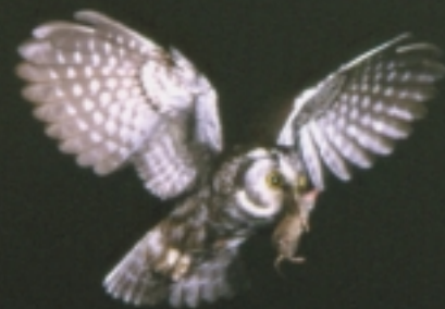
Son régime alimentaire est presque exclusivement constitué de petits rongeurs