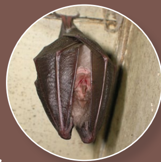
Le Petit rhinolophe s'enveloppe dans ses ailes noires et reste suspendu au plafond de son gîte, comme le Grand rhinolophe.

25 espèces de chauves-souris sont connues dans le Grand Est (34 espèces connues en France métropolitaine). Certaines sont communes dans les villes et villages : Pipistrelle commune et Sérotine commune. Certaines sont rares : Grand rhinolophe, Grand murin, Barbastelle, etc.