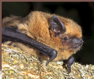
La Pipistrelle commune est très présente dans les villages et les habitations. Elle peut se loger dans de petits espaces : à l'arrière des volets, dans des fissures, sous les tuiles. Même adulte, elle est de petite taille : la longueur du corps ne dépasse pas 5 cm.

Chaque nuit, elles capturent des quantités impressionnantes de moustiques, papillons de nuit, coléoptères, araignées. Une Pipistrelle commune ingère plus de 1000 moustiques par nuit !