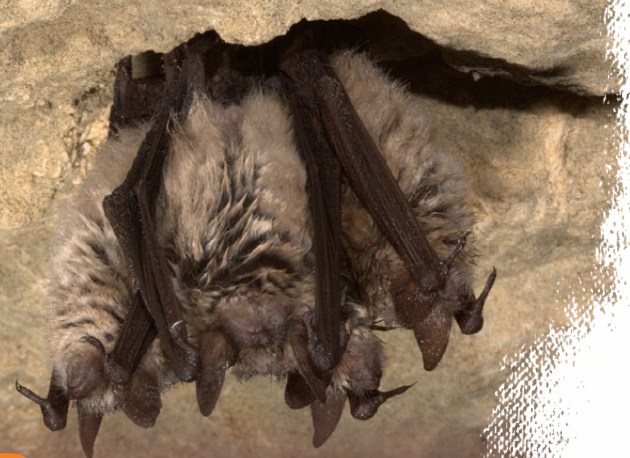
Vespertilion à oreilles échanquées