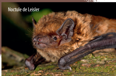
Noctule de Leisler

En France et en Europe, toutes les chauves-souris sont protégées par la loi. Les détruire, les capturer, les déplacer ou porter atteinte à leur gîte et/ou leurs habitats est donc interdit.